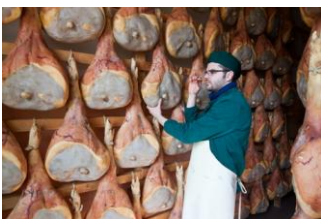
Сыровяленая ветчина Сан Даниеле