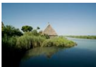
Хижины рыбаков в лагуне