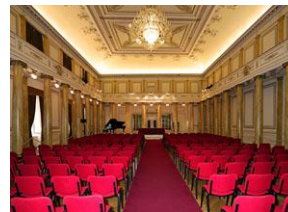
Фойе Театра Верди