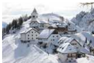
Святыни Монте Луссари