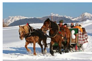
Прогулка в экипаже