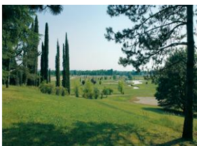
Гольф-клуб Замок Спесса