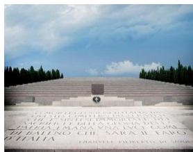
Святилище в Редипулья