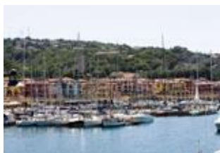
Порт Сан Рокко – Муджия