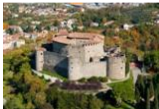
Замок в Гориции