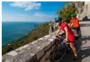
Тур на велосипеде