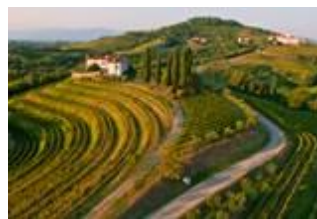
Виноградники дель Коллио