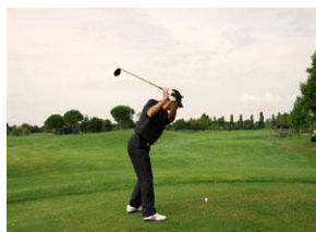
Игрок в гольф