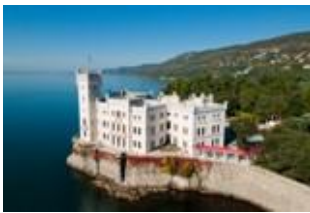
Замок Мирамаре – Триест