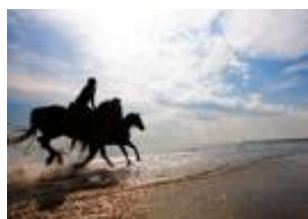
Лошади на пляже