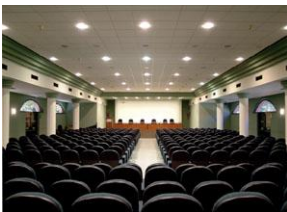
Центр Конгрессов Удине

Sales Guide – справочник, объединяющий все конференц-центры , сертифицированные на основе параметров Federcongressi . Публикация, предоставляющая перечень услуг данной отрасли, а также ряд предложений возможных маршрутов до и после проведения конференции, является эффективным и единым инструментом, который может сообщить собственные преимущества по предложению проведения конгрессов во Фриули-Венеции-Джулии. Постоянно обновляется Интернет-сайт, посвященный туризму и конгрессам в регионе ( www.congressfvg.it ).