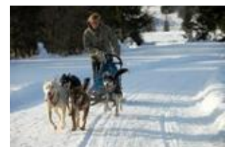
Катание на ездовых собаках

Agenzia Turismo Friuli Venezia Giulia - Агентство по туризму Фриули Венеции Джулии – Отдел прессы