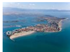
Градо, вид с высоты

Agenzia Turismo Friuli Venezia Giulia - Агентство по туризму Фриули Венеции Джулии – Отдел прессы